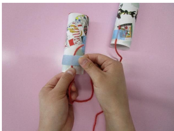
ひもを筒のサイドにつける