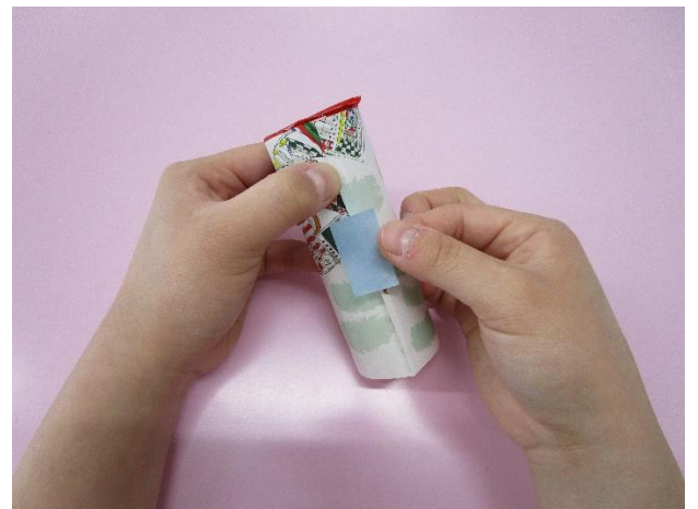
紙を巻いてセロハンテープで とめる