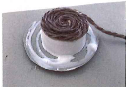
④ けいとをまきながらくつつける