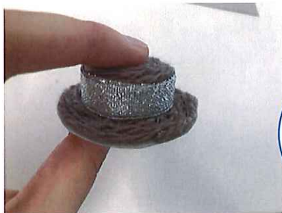
⑤ りぼんをまいてかんせい!

めのをつかってもかわい いですよ! ひもや、ちえ ーんをつけたらキーホル ダーにもなりますね☆