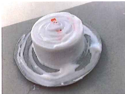
③ ぜんたいにぼんどをめる