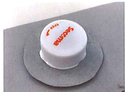
② あつがみのまんなか きやつぷをぼんどでくつつける