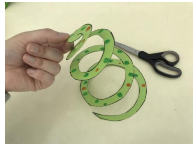
④うずまきにそってきる