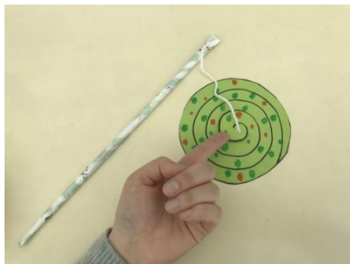
⑤ぼうにひもをつなげて、うずまきとひもをていぷでとめる