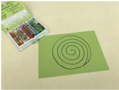
①がようしにうずまきをかく