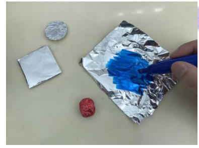
③あるみほいるに いろをぬって まるめる