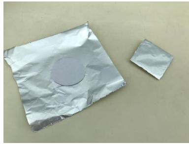
②あるみほいるでつつむ