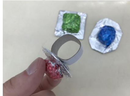
⑤あつがみで わをつくり てーぷでとめる